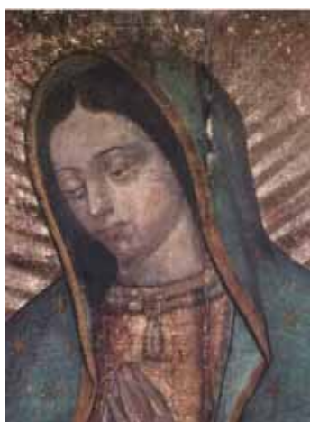
Ovo je Pravi Lik Presvete Marije Naša Gospa iz Guadalupe