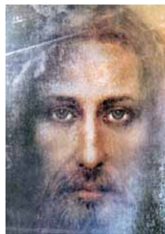
Vero Santo Volto di Gesù Ovo Je Pravi Lik Isusa

Bez obzira dali se odnosi na intelektualce, političare, znanstvenike, mudrace ili nove Proroke, ukratko, tko god bi pokušao komunicirati preko riječi ili pismeno da bi objasnio ostalima temeljne pogreške koje se čine u svijetu ostajući daleko od Boga, bili bi prigušeni da ne bi smetali moćnim skupinama, spletkarima u biti, u postizanju njihovih demonskih i destruktivnih namjera. Uz jake snage na stupnju laikata i Crkve uspela se sabotirati, skoro potpuno i nepopustljivo, svaka misao ili Otkrivenje.