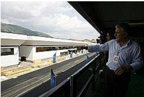
Le nuove palazzine allestite per ospitare le delegazioni all'Aquila

Da oggi gli edifici diventano "zona rossa": nessuno si potrà avvicinare senza pass Mobilitati i militari: 15mila uomini impegnati. E dai cieli vigilerà un Predator dal nostro inviato JENNER MELETTI