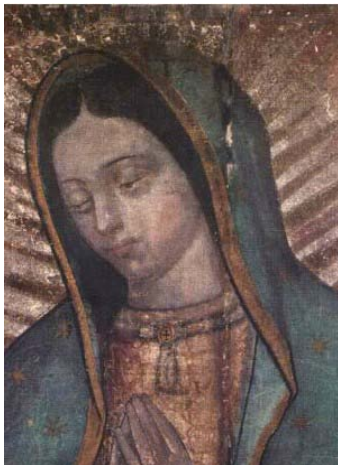
Vero Santo Volto di Maria Santissima Nostra Signora di Guadalupe