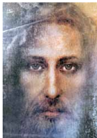
Vero Santo Volto di Gesù Ovo Je Pravi Lik Isusa

Bez obzira dali se odnosi na intelektualce, političare, znanstvenike, mudrace ili nove Proroke, ukratko, tko god bi pokušao komunicirati preko riječi ili pismeno da bi objasnio ostalima temeljne pogreške koje se čine u svijetu ostajući daleko od Boga, bili bi prigušeni da ne bi smetali moćnim skupinama, spletkarima u biti, u postizanju njihovih demonskih i destruktivnih namjera. Uz jake snage na stupnju laikata i Crkve uspjela se sabotirati, skoro potpuno i nepopustljivo, svaka misao ili Otkrivenje.