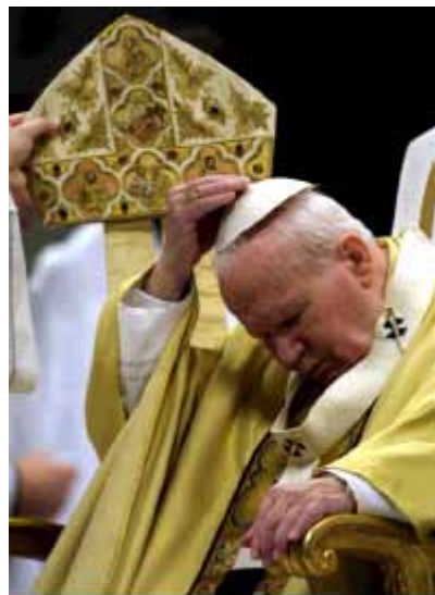
Papa Giovanni Paolo II

El Motus proprio autoriza a la Congregación a establecer líneas guías para afrontar el problema, mientras que el cardenal Ratzinger les pide "no sólo a los obispos de contribuir a evitar un crimen tan grave, pero también de proteger con las necesarias sanciones la santidad del sacerdocio y la cura pastoral ofrecida por los obispos y de los otros responsables eclesiásticos."