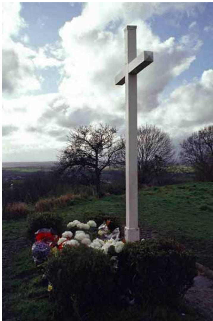
La Haute Butte de Dozulé.

Sobre este monte la Santa Iglesia Católica por Voluntad de Dios, ya habría tenido que erigir la Cruz de 738 metros x 123 mts para anunciar la Próxima Venida de Jesús sobre la Tierra.