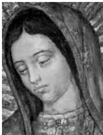
Naša Gospa iz Guadalupe