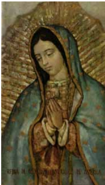
Naša Gospa iz Guadalupe Pravi Lik Presvete Marije