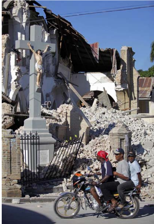
Bez Riječi... RASPELO

HAARP: Zavjera USA geofizičkim oružjem sposobnim da izazove potrese u svijetu ili fantazija?