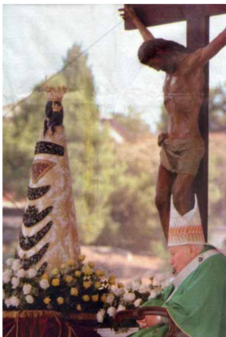
Na foto: Papa João Paulo II em Loreto, explanada de Montorso Domingo 5 de setembro de 2004