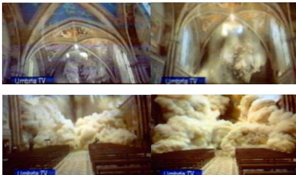
La spettacolare sequenza del crollo del transetto nella Basilica Superiore di San Francesco. Immagini riprese da Umbria TV.

Queste sono alcune conseguenze e cifre del terremoto.