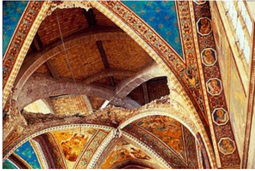
La volta di Cimabue dopo il crollo nella Basilica di Assisi http://www.moveaboutitaly.com/umbria/terremoto97_it.html