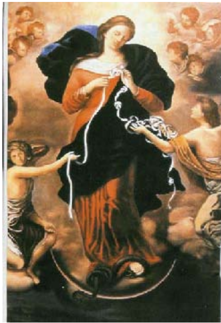
Dipinto venerato nella Chiesa di San Peter Am Perlach di Asburgo (Augsburg) Germania